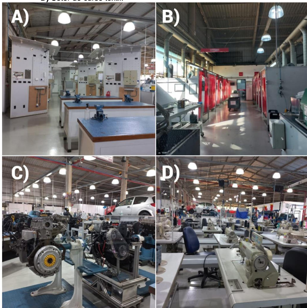
Figura 02. Interior do barracão do SENAI – Ourinhos, S.P. A) Bancadas de trabalho B) Área reservada para solda dos metais C) Setor do curso automobilístico D) Setor do curso têxtil.