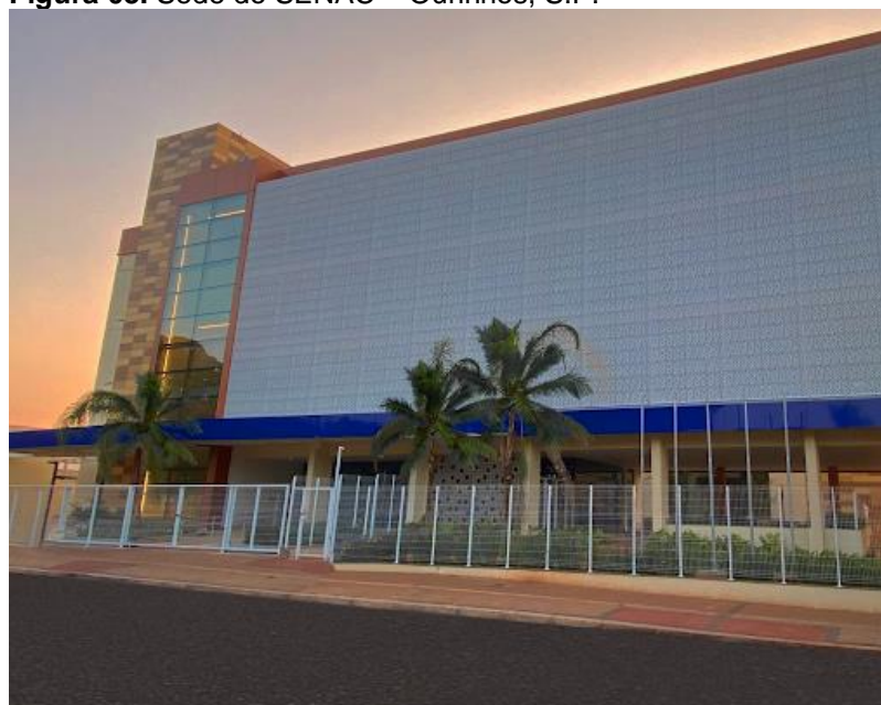
Figura 03. Sede do SENAC – Ourinhos, S.P.

O Serviço Nacional de Aprendizagem Comercial (SENAC), foi fundado em 10 de janeiro de 1946 como resultado da Lei nº 4.048, que também criou o SENAI (Serviço Nacional de Aprendizagem Industrial), dessa vez, com o propósito de fornecer educação e capacitação profissional nas áreas relacionadas ao comércio de mercadorias, prestação de serviços e turismo.