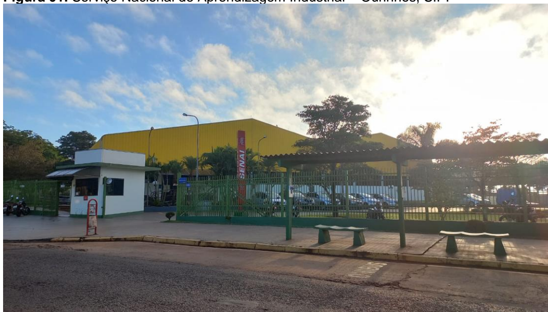
Figura 01. Serviço Nacional de Aprendizagem Industrial – Ourinhos, S.P.

“Em seus 73 anos de história, o SENAI qualificou mais de 61 milhões de trabalhadores e educou mais de 50 mil pessoas por meio de cursos à distância. A cada ano, a instituição atrai mais de 3 milhões de estudantes de países em desenvolvimento, especialmente de países africanos de língua portuguesa, e 80% dos seus alunos encontram emprego”, afirma o estudo presente no portal do Senai de SC. (SC SENAI, 2016)