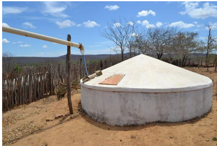
Figura 2 Programa Cisternas do Governo Federal garante a segurança alimentar ao semiárido nordestino