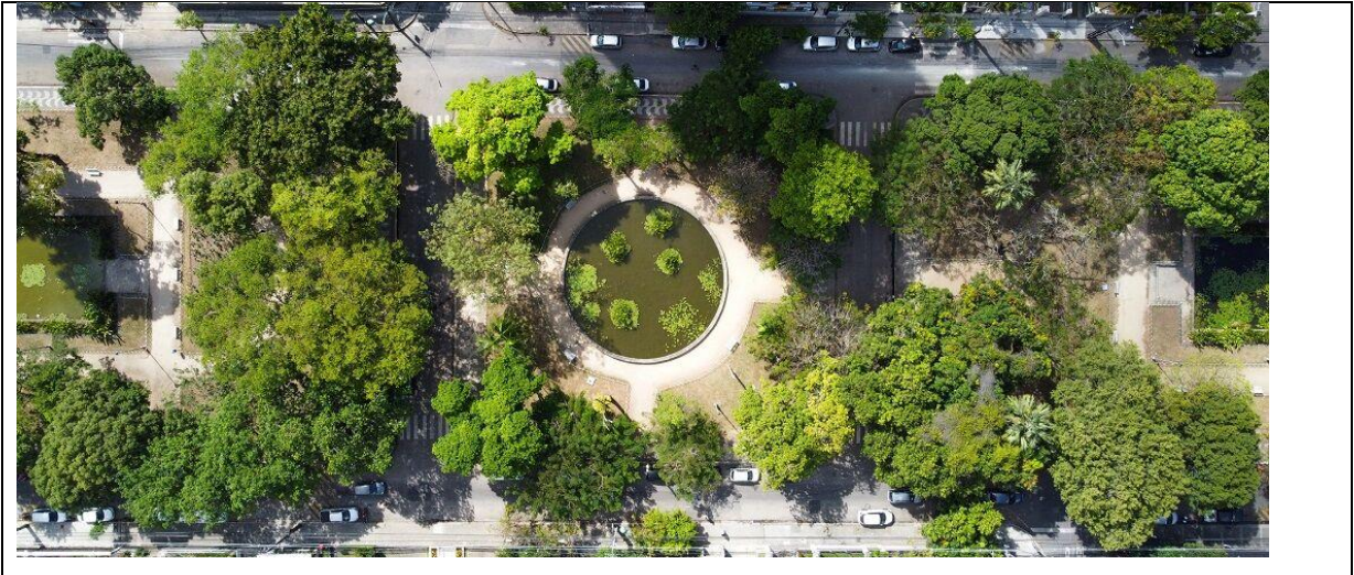
Figura 02. Vista aérea da praça de casa forte.