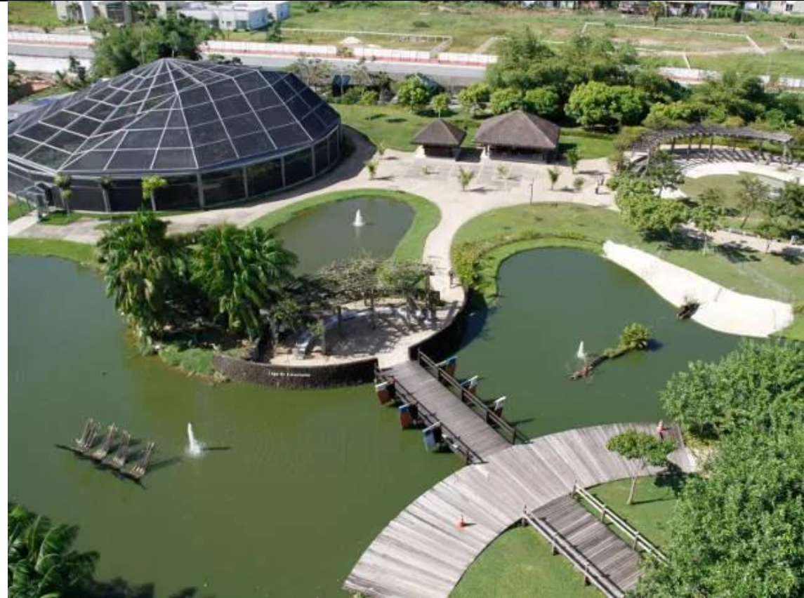
Figura 01. Lago e Borboletário do Mangal das Garças.