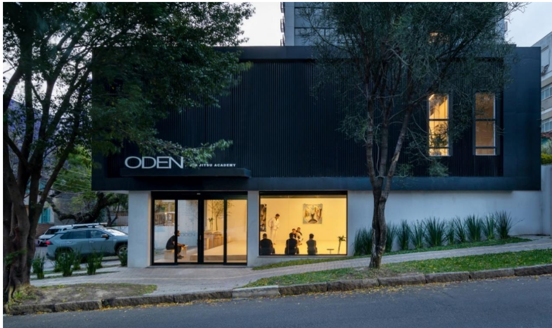
Figura 03. Fachada Principal do Centro de Treinamento Oden Jiu-jitsu Academy, Porto Alegre, RS.