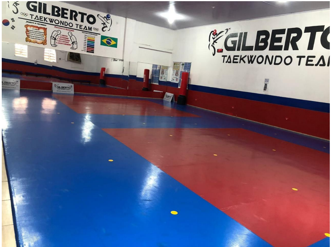
Figura 02. Área de Treinamento do Centro de Treinamento Gilberto Taekwondo Team, Santo Antônio da Platina – PR.

utilizado para a exposição de medalhas, troféus e certificados, destacando as conquistas e a história da nossa instituição.