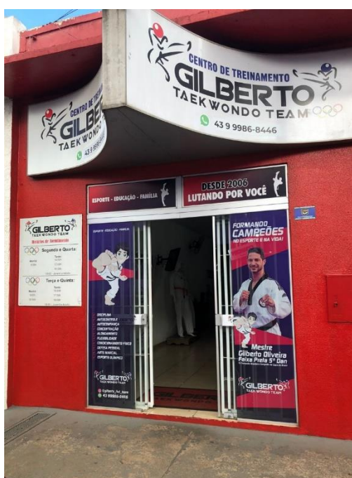
Figura 01. Centro de Treinamento Gilberto Taekwondo Team, Santo Antônio da Platina – PR.

A academia está situada no centro da cidade de Santo Antônio da Platina, PR, em uma área mista de residências e comércios. Originalmente, o edifício não foi concebido para ser um centro de treinamento, e seu uso anterior permanece desconhecido. No entanto, após reformas e adaptações, tornou-se um dos centros de treinamento mais renomados da região.