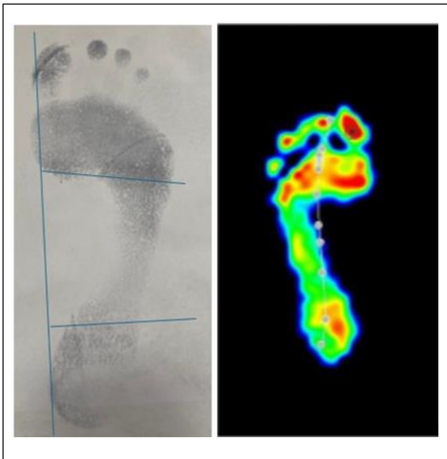
Figura 3 – Imagem obtida avaliação observada no baropodômetro.