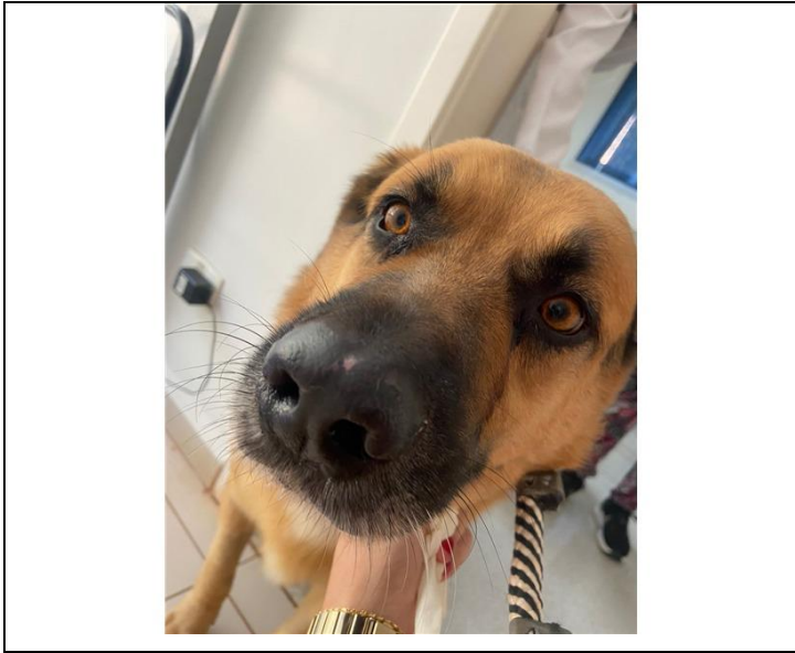
Figura 3: Lesão em plano nasal após 24 dias de tratamento.