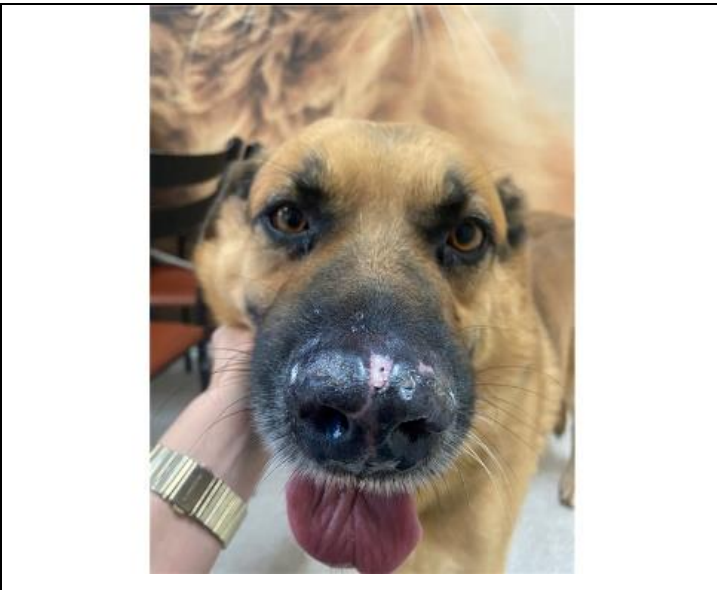
Figura 2: Lesão em plano nasal após 10 dias de tratamento.